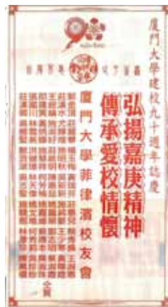
菲律宾校友会在《世界日报》用大幅版面刊登母校90华诞信息，表达对母校的祝福