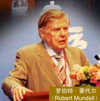
罗伯特·蒙代尔 (Robert Mundell)