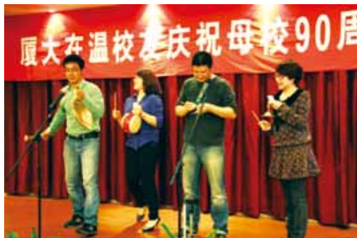
校友合作表演校庆“三句半”

4月16日晚6时，厦大在温校友庆祝母校90周年联谊会在市区万豪商务酒店会议厅举行。近100名校友齐聚一堂，载歌载舞，一道回忆厦大建校以来的辉煌历程，共同为母校盛大的节日深深祝愿。