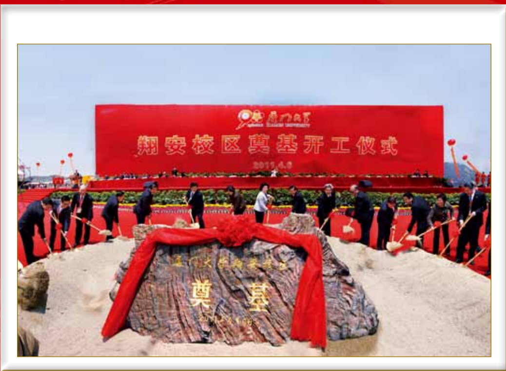
4月6日上午，厦门大学翔安校区奠基开工仪式隆重举行