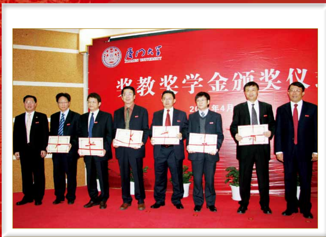
4月5日上午，学校颁发2011年度奖教奖学金