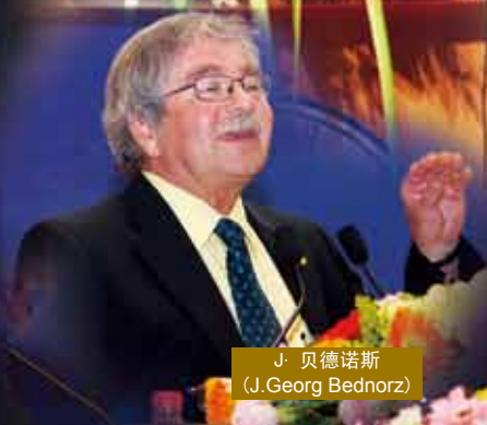
J·贝德诺斯 (J.Georg Bednorz)