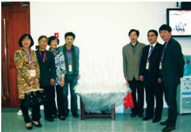
浙江校友会代表在赠送给母校的“陈嘉庚和毛泽东合影琉璃雕”前合影