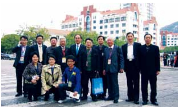
上海校友会祝贺团在母校校园里合影