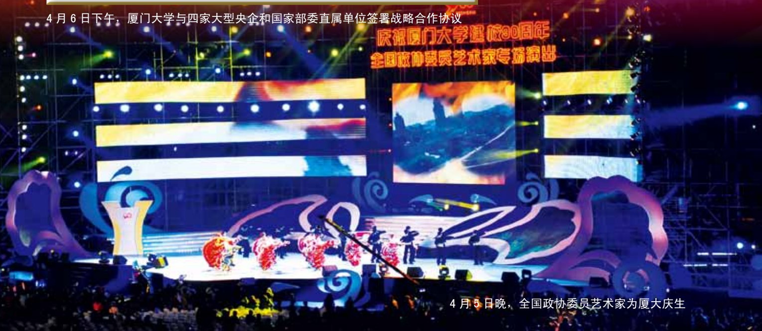
4月5日晚，全国政协委员艺术家为厦大庆生