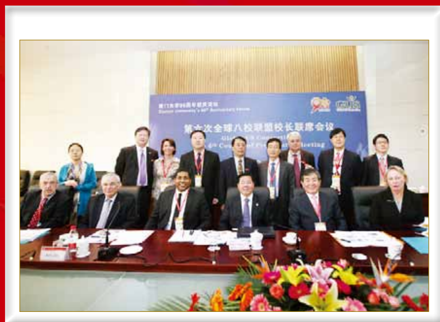
4月7日上午，“八校联盟”校长第六次联席会议在我校举行