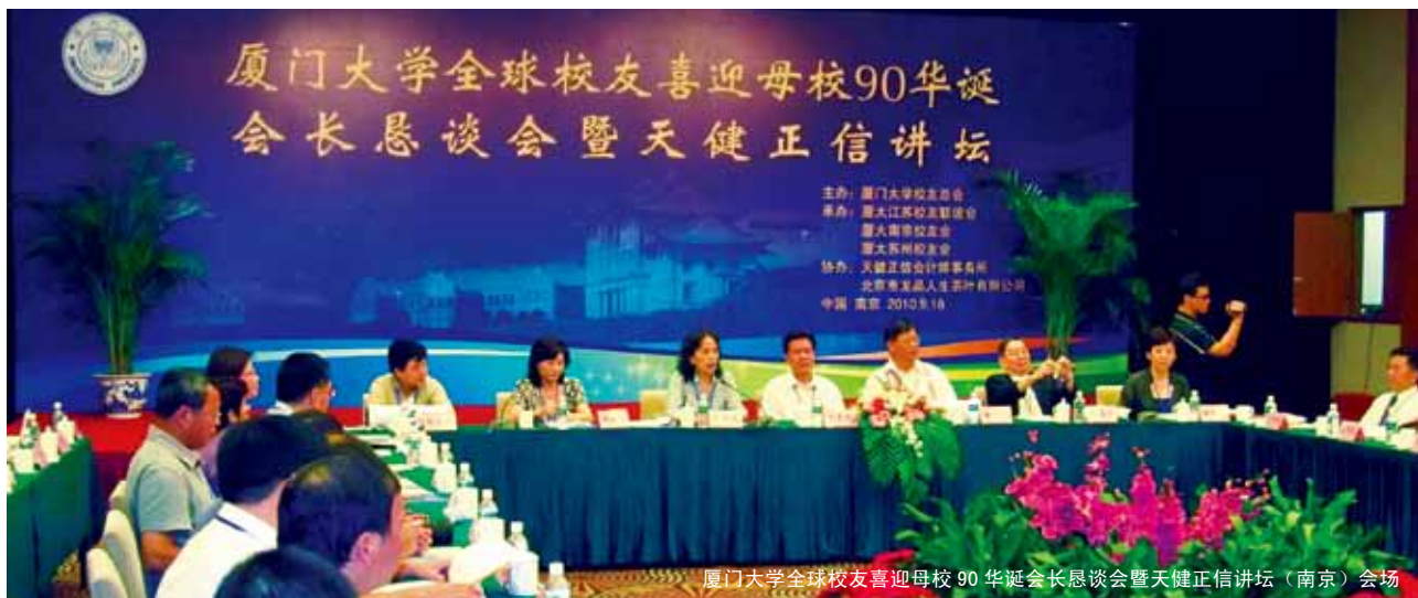
厦门大学全球校友喜迎母校 90 华诞会长恳谈会暨天健正信讲坛（南京）会场