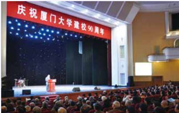
北京校友在全国政协礼堂共庆母校 90 华诞

阳春布德泽，万物生光辉，由爱国华侨领袖陈嘉庚先生创办的厦门大学即将迎来 90 周年华诞。3 月 27 日，厦门大学北京校友会在全国政协礼堂举行庆典，隆重庆祝母校厦门大学建校 90 周年，北京千余名校友参加了庆典活动，庆典会场座无虚席。本次庆典由厦门大学北京校友会常务副会长孙亚夫校友主持。