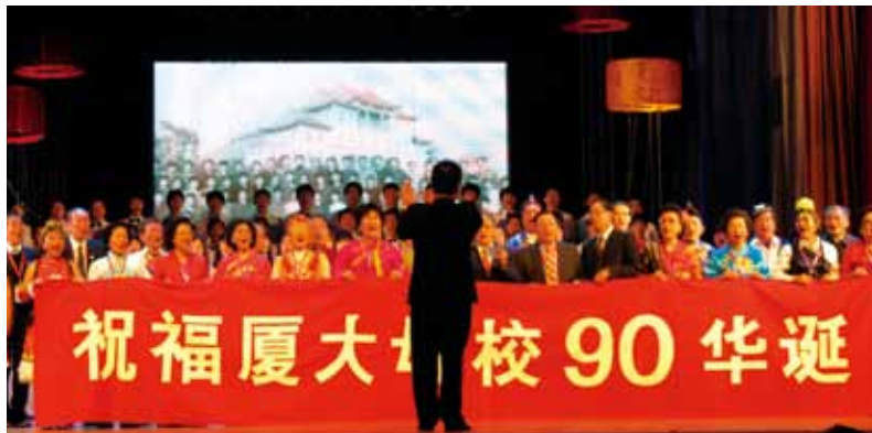
泰国校友合唱团在《南强颂》晚会上表演节目并展示“祝福厦大母校90华诞”标语