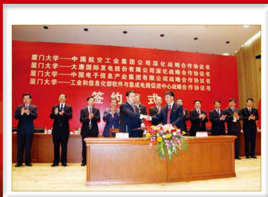
4月6日下午，厦门大学与四家大型央企和国家部委直属单位签署战略合作协议