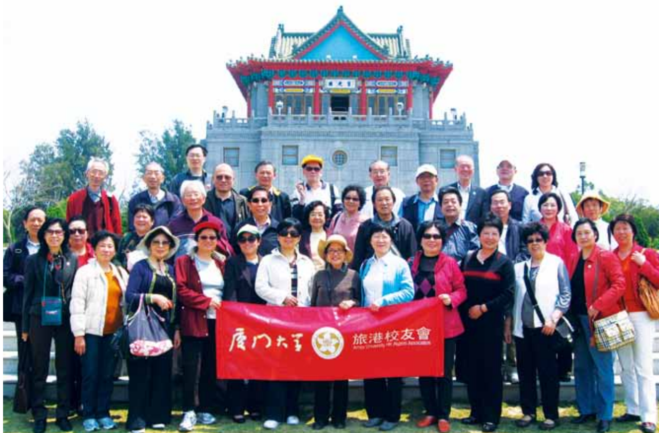
旅港校友们参加金门一日游时合影留念

论是师生情、同窗情、还是校友情，都凝聚着母校师长们的心血，同窗友谊不可抵，校友之情胜似亲情。大家都十分珍惜，相互勉励为国家繁荣富强，为母校未来发展做出新的贡献！