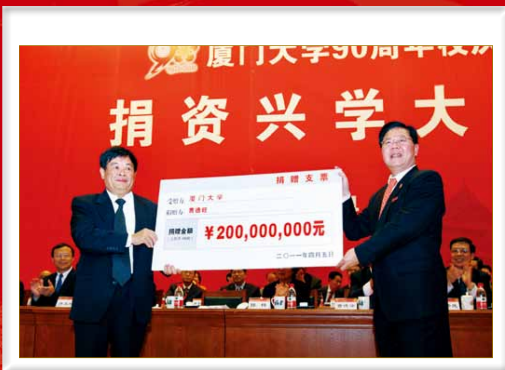
4月5日下午，厦门大学90周年校庆捐资兴学大会隆重召开