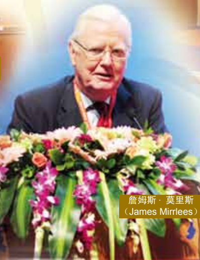
詹姆斯·莫里斯 (James Mirrlees)