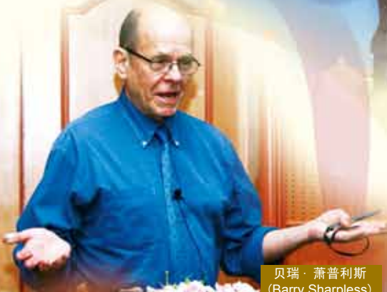
贝瑞·萧普利斯 (Barry Sharpless)