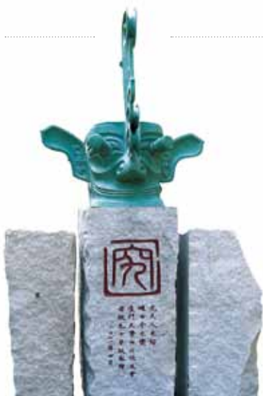
四川校友会捐赠给母校的青铜人面纵目雕像