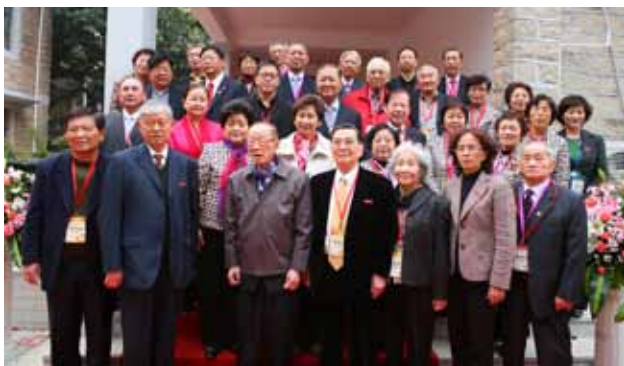
学校、校友总会领导与菲律宾校友庆贺团在怀贤楼前合影

在陈嘉庚先生爱国兴教、倾资办学的伟大精神感召下，厦门大学校友素有饮水思源、造福桑梓的美德和传统。长期以来，菲律宾校友和友好人士为厦门大学教育事业做出了宝贵的贡献。时值我校90周年校庆，菲律宾校友会及菲律宾中正学院嘉宾不远万里来到厦门，为我校校庆送上真挚祝福和良好期盼，共襄母校华诞盛事。