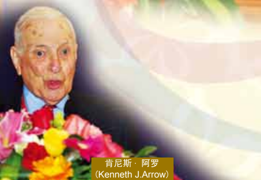
肯尼斯·阿罗 (Kenneth J.Arrow)