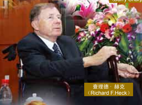
查理德·赫克 (Richard F.Heck)