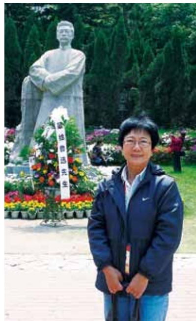
爱薇校友在鲁迅广场前留影

她是马来西亚一位笔耕40余年不辍的资深女作家，除了国内各大报刊外，她的作品也经常刊载于新加坡、泰国、香港、台湾和中国等地。曾经连续两次获得读者票选为国内十大最受欢迎作家之一、国内闽籍杰出女性文化奖、最伟大母亲奖等。现已结集出版有小说、散文、报道文学、儿童文学等53册。