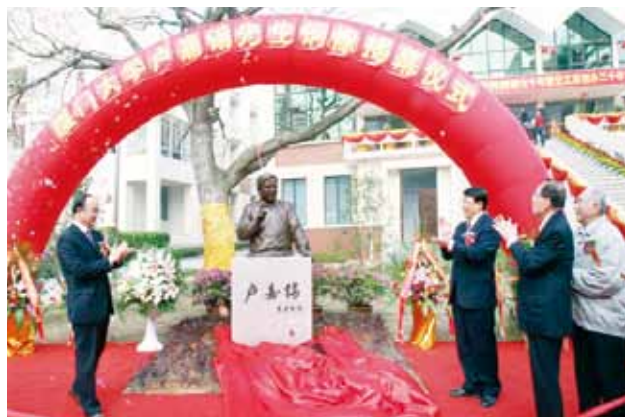
卢嘉锡铜像揭幕仪式隆重举行

铜像座落于化学报告厅前，连底座高2.2米，神态自然、面容亲切，时间被定格在先生讲课的一瞬间，耳边仿佛响起先生对学子的谆谆教诲。铜像由著名雕塑家、广州美术学院曹崇恩教授制作。制作过程中，卢嘉锡先生的儿子卢嵩岳、卢象乾和卢龙泉曾多次就铜像提出修改意见，以求能生动展现先生风范。