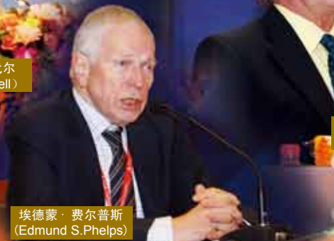
埃德蒙·费尔普斯 (Edmund S.Phelps)