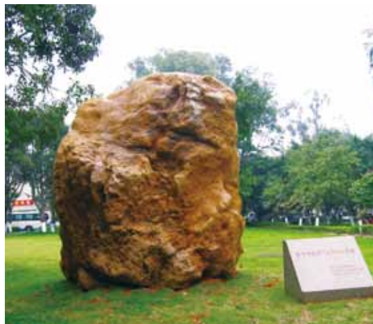
深圳校友会捐赠给母校的黄蜡石

黄蜡石又名龙王玉，因石表层内蜡质感色感而得名，润滑细腻，质胜于玉，包浆滋润，极富灵气，在观赏石界极富盛名。深圳校友捐赠的黄蜡石被放置在大南校门附近的草地上，与学校图书馆相对，质朴天然、未经雕琢，具备湿、润、密、透、凝、腻等“石之六德”，堪称石中极品。