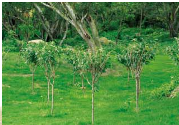
种植在高尔夫练习场山坡上的樱花树苗