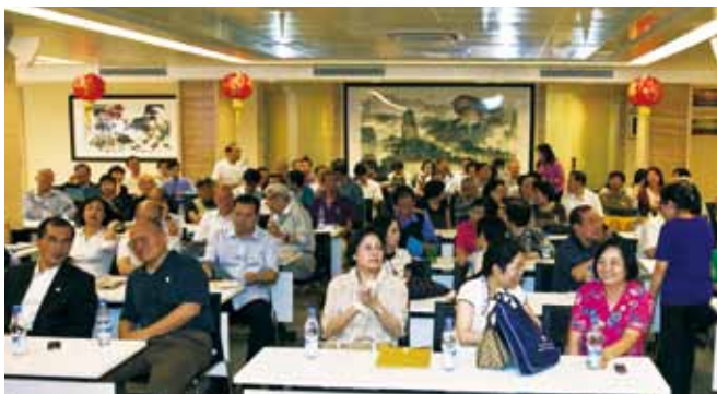
旅港校友欢聚一堂共庆母校 90 华诞

参加母校庆典活动归来，又逢旅港校友同乐联欢，回顾校庆活动最让我铭记难忘的有两点：一是志愿者好，年轻学子热情友好，仪态美，心灵美；二是厦大美，九十年华依然青春，校园美，精神美。借此机会，我诚恳推荐未返回母校的校友至少要潇洒走一回，去看校园内花的海洋，花的王国，锦上添花，花色秀丽；古今中外建筑风格融为一体，建南大礼堂永不逊色，嘉庚楼群尽善尽美，气势磅礴。处处风景幅幅画，景中有画画融实景：山是那座山——五老峰傲然