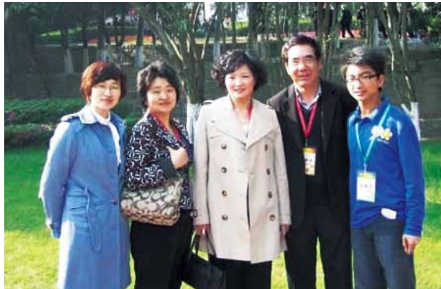
作者（右一）与部分上海学长合影

公务繁忙的他，本来是要派一名公司的主任过来代他报到的，但在听过我希望和他见一面后，他爽快地答应要亲自过来报到了。见面后发现，身为大型国企高管的他，身上充满儒雅的气息，丝毫